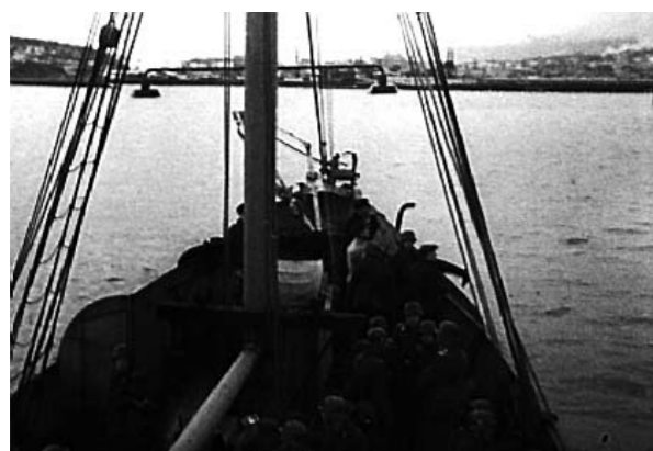
MOT TRONDHEIM: «Gegen Drontheim Hafen», kommenterer stemmen på filmen. De tyske styrkene er på vei inn mot Trondheim havn.