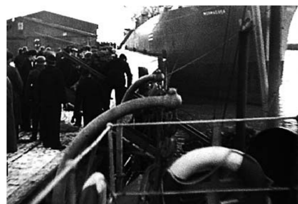
TIL KAI: Tyske soldater på vei inn mot Trondheim med skip. Det gjøres klart for landgang.