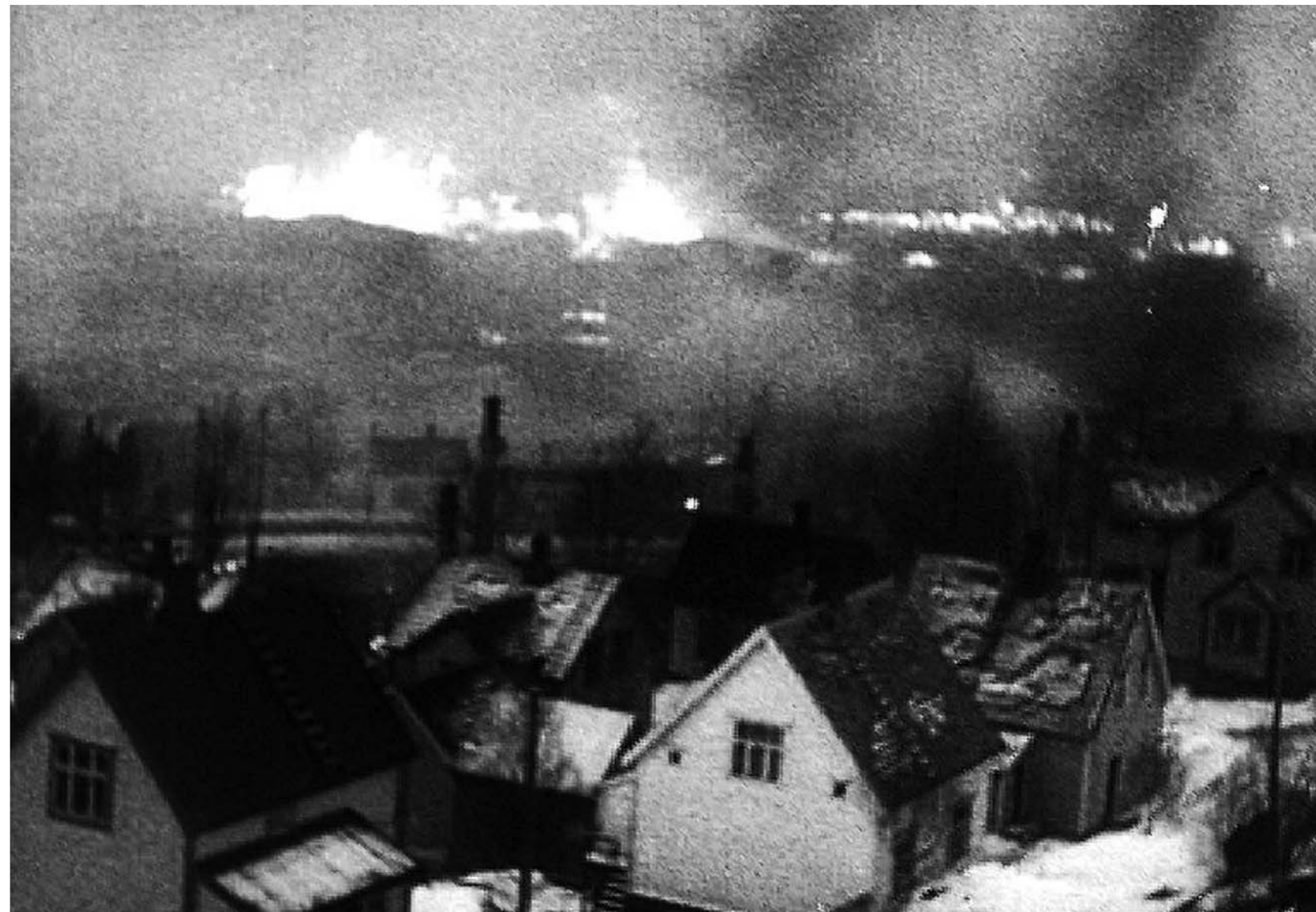
NAMSOS BRENNER: De tyske krigsfotografene deltok i fremste linje under hele felttoget i Midt-Norge, og fikk også festet til film den voldsomme brannen etter at deres egne fly bombet byen.