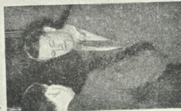
Misgrascheh R. i. h. v. d. (tilhøve) i samtale med en av (tske-journalistene) idag.

Jeg oppfordrer inntrengende alle landemenn til å vise besluttsomhet og ro. Jo mer vi og panikk skapes, desto vanskeligere og verre blir situasjonen for landet og for den enkelte. De som er reist bort fra sine hjem bør snarest vende tilbake og i ro gjenoppta sitt vanlige arbeid. Det gjelder de mobiliserte såvel som de civile. Fra min regjerings side har dere intet å frykte. Min oppgave er å ta i hen og vanskelighetene livet for mine landemenn. Min vanskelige oppgave er tredoblet med alle midler å maldre for mine landemenn