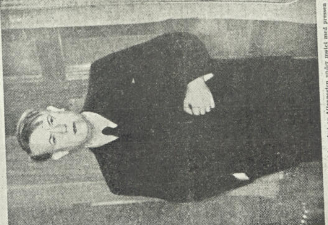
Statsminister Quisling, fotografert av Aftenposten under møtet med pressen idag.

Han bevedet at regjeringen, Nykarsvold etter de britiske patruljebrydd med minne den burde ikke grep inn på den indre delen, men hadde innsett at det var viktig å teste. Tyskland så seg derfor nødt til å vurdere sine livsinteresser og disse ikke var livsinteresser. Dette ved at Norge med seg i dette. Det var tyskernes syn på saken. Han bevedet videre at Norge med initiativt bare hadde vært inn i Nykarsvold men, idet regjeringen til den ene side, alltid hadde skjedd til den ene side. Det var hans mening at vi allerede under Finlandkrigen var nær en po-